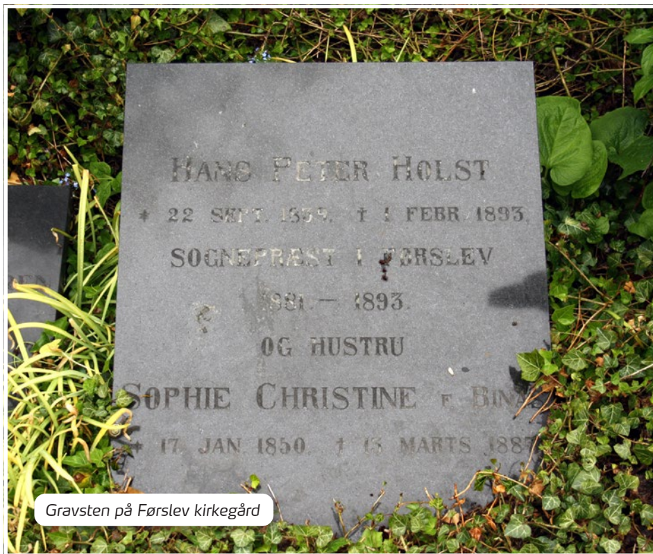
Gravsten på Førsløv kirkegård

Hans tid i Førsløv faldt sammen med provisorietiden, hvor Højre-regeringen, ledet af konseilspræsident Estrup, som ikke havde flertal i Folketinget, udstedte foreløbige love, herunder den årlige finanslov. Dette skabte stor uvilje mod regeringen og partiet Højre og udløste stridigheder, også på lokalt plan.