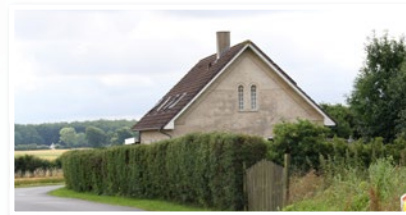
Det tidl. Sneslev Missionshus 2025.

opstod forskellige kirkelige retninger, grundtvigianerne, som oprettede frimenigheder og valgmenigheder, og Indre Mission, som efterhånden fandt hjemsted i de mange missionshuse, som – godt nok noget senere – skød op i sognene. Der blev oprettet en frimenighed på Høve Mark, som senere blev til en valgmenighed, og der blev opført missionshuse flere steder i de sogne, som nu udgør Sandved Pastorat: Sneslev i Førsløv Sogn, Tornemark i Fyrendal Sogn, Sandved i Hårslev sogn og Krummerup i sognet af samme navn. Konceptet var stort set ens alle vegne. En lokal kreds skaffede en egnet byg-