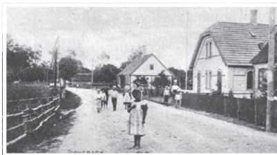
Postkort med Tornemark Missionshus fra begyndelsen af 1900-tallet.