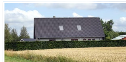
Det tidl. Krummerup Missionshus 2025.